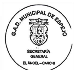
SECRETARIO GENERAL (E) DEL GADM-E