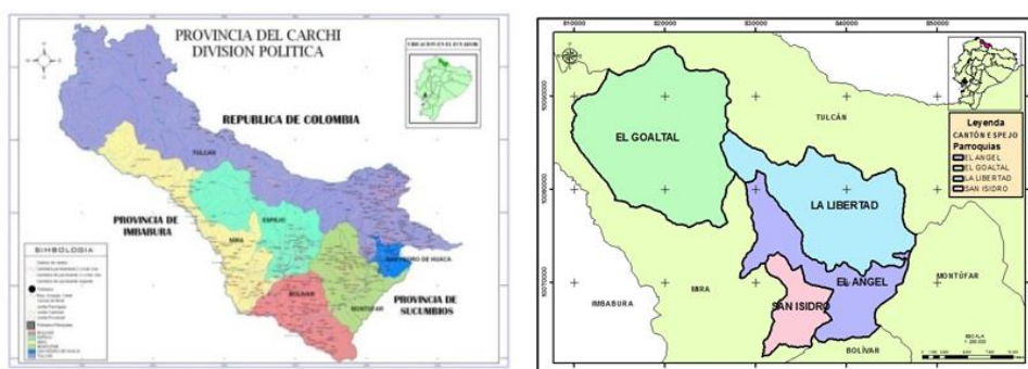
Mapa 1. Mapa del Cantón Espejo

El proyecto se ejecutará en el Cantón Espejo, se encuentra geográficamente ubicado al norte del Ecuador formando parte de la provincia del Carchi, este cantón tiene una extensión de 557.73 Km 2 , se encuentra a una altura de 4.000msnm como máximo y 1800 msnm como cota mínima. Su temperatura oscila entre los 11° C en áreas intermedias, en el páramo entre 7°-10° y en tierras bajas por los 26° centígrados.