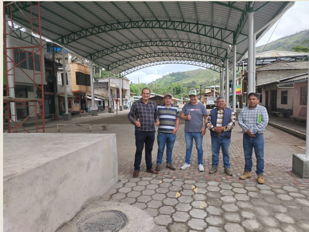
FISCALIZACIÓN DE LA CUBIERTA METÁLICA EN LA PARROQUIA DE EL GOALTAL